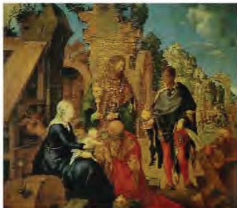
Anbetung der Könige Albrecht Dürer (Nuremberg 1471 - 1528)