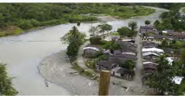
Impressie van de regio

U kunt dit werk ook steunen door geld over te maken op NL 63 RABO 0350 2541 84 ten name van Kerk in Actie PGO.